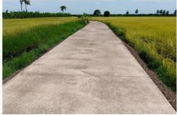
๑๐.โครงการก่อสร้างถนนค.ส.ล.ริมคลองชลประทาน หมู่ที่ ๒