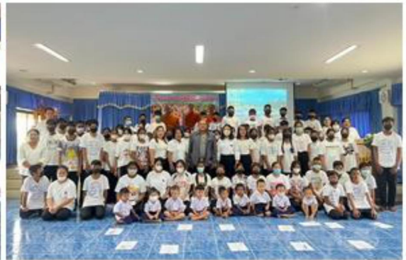
๒๓.โครงการสืบสานภูมิปัญญาท้องถิ่น (ข้าวต้มมัด)