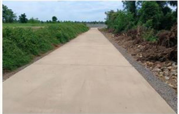
๗.โครงการก่อสร้างถนนค.ส.ล.สายข้างบ้านนายเนรมิต ทองกระจ่าง หมู่ที่ ๓