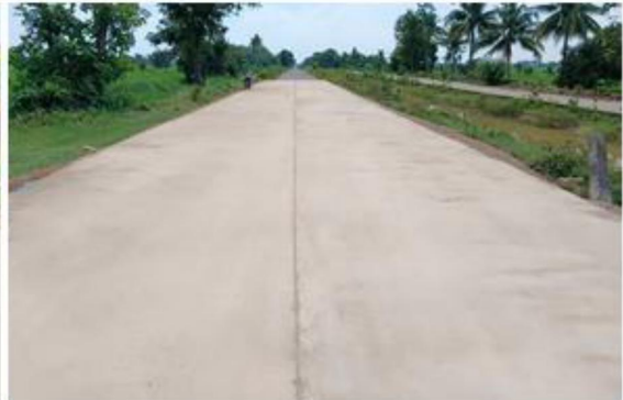
๑๒.โครงการก่อสร้างถนนค.ส.ล.สายริมคลองลำมะเส็ง (๒๐L-๑R) หมู่ที่ ๒