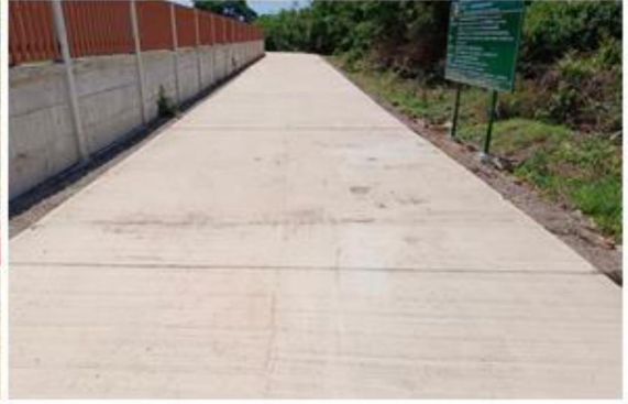
๖.โครงการก่อสร้างถนนค.ส.ล.สายข้างที่ดินนายวิเชียร แจ่มข่าว หมู่ที่ ๒