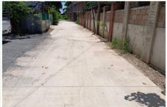
๘.โครงการก่อสร้างถนนค.ส.ล.สายคู ๑๕.๔ (๒๐L-๑R) หมู่ที่ ๑ สายข้างนางนางเอียง เทศนา