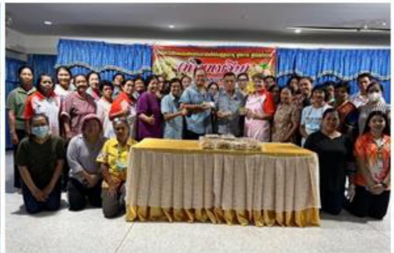
๒๐.โครงการรณรงค์เฝ้าระวัง ควบคุม ป้องกัน และระงับการแพร่ระบาดของโรคไข้เลือดออก