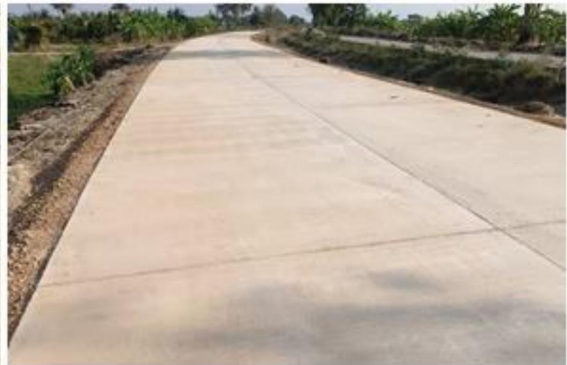
๑๑.โครงการก่อสร้างถนนค.ส.ล.สายริมคลองชลประทาน (๒๐L-๑R) หมู่ที่ ๒