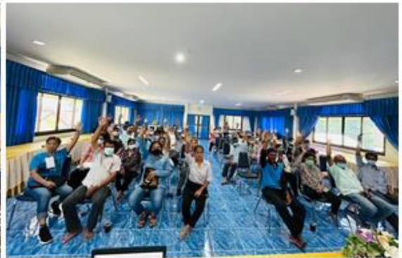
๓๕.โครงการ ๑ อปท. ๑ สวนสมุนไพร เฉลิมพระเกียรติฯ